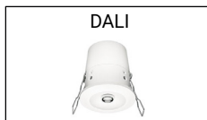
SENSOR DE LUZ Y PRESENCIA LIGHT AND PRESENCE SENSOR